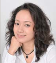
魔法使い ドロロソ 金子 あい