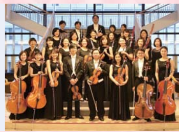
演奏 愛知室内オーケストラ