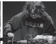
Hair Stylistics(a.k.a. 中原昌也)