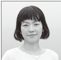
立山ひろみ 演出家 「ニグロノータ」主宰 宮崎県立芸術劇場演劇ディレクター