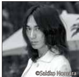
岩淵貞太 ダンサー・振付家