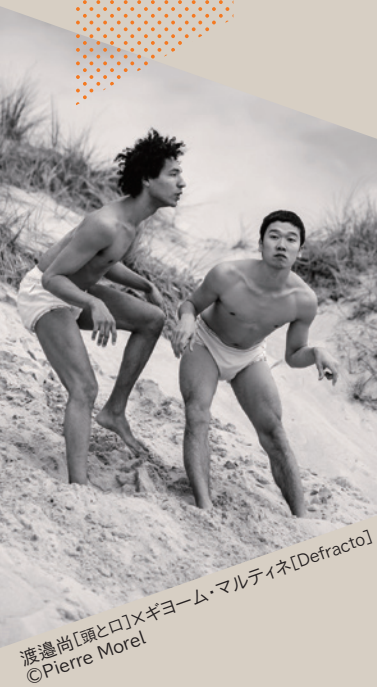
渡邊尚[頭と口]×ギヨーム・マルティネ[Defracto]