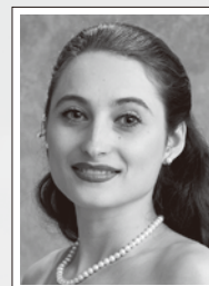
オクサーナ・ステパニユック