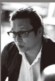
美術 大巻伸嗣 Shinji Ohmaki

岐阜県出身。「存在」とは何かをテーマに制作活動を展開する。環境や他者といった外界と、記憶や意識などの内界、その境界である身体の関係性を探り、三者の間で揺れ動く、曖昧で捉えどころのない「存在」に迫るための身体的時空間の創出を試みる。弘前レンガ倉庫美術館にて個展を開催中。11月から国立新美術館にて個展を開催予定。