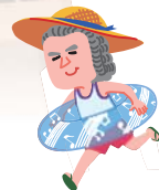
イラスト:とりやま ゆり