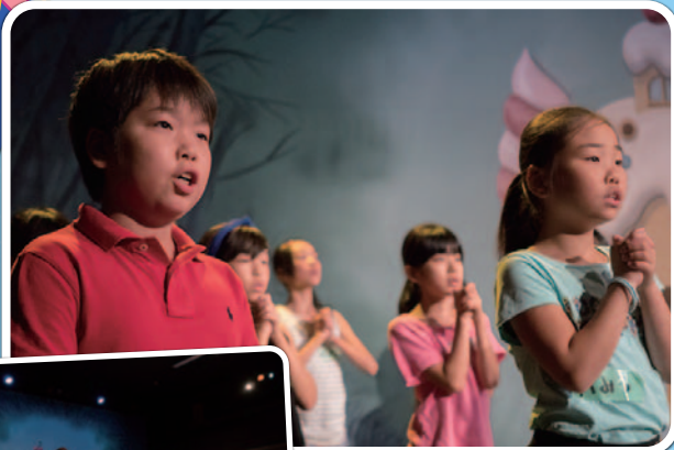
2015年度オペラ体験!の様子