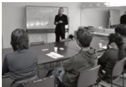
昨年度のセッションの様子