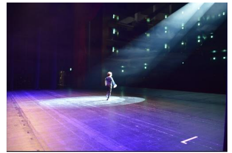
「おとな」のげきじょうたんけんツアー」(2024年度)より

ステージ上でスポットライトを浴びる体験ができるコーナー。著名なダンサーのお決まりのポーズやオリジナルの決めポーズをとりながら、お手持ちのスマートフォン等で写真等を撮影いただけます。