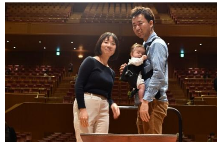
愛知県芸術劇場オープンハウス 2023 より

日本最大級のパイプオルガンや、残響時間 2.1 秒（満席時）のクラシック音楽に最適な響きが特徴的な施設として愛される「コンサートホール」のステージや客席、ホワイエ、ビュッフェなどを自由見学いただけます。はじめの 15 分は、「お化け屋敷 TIME」としてオルガンや照明を使ったほんのり怖い空間をお楽しみください。そのほか、当劇場の自主事業の写真などを展示します。