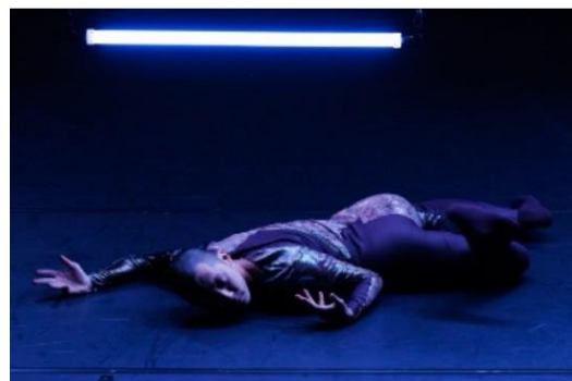
鈴木竜『never thought it would』©Naoshi HATORI