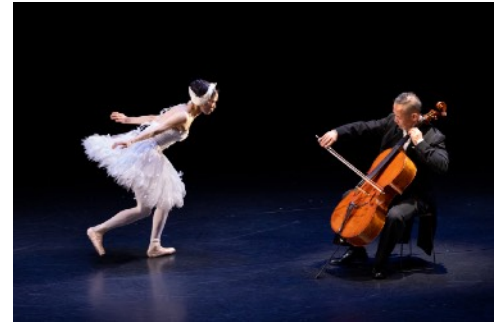
ダンスの系譜学『瀕死の白鳥 その死の真相』