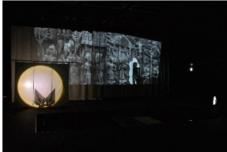
インドネシアの伝統的な影絵芝居 「ワヤン・クリ」を用いた演出 (2020年7月の稽古より)