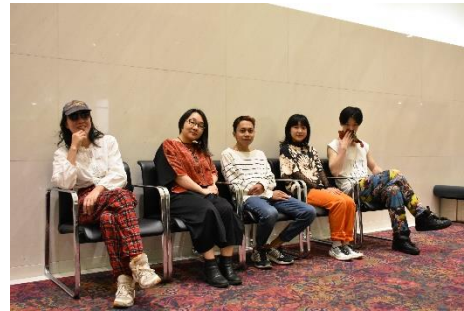
日本人、インドネシア人、カナダ人など、 ボーダレスに集う個性的なパフォーマーとスタッフ