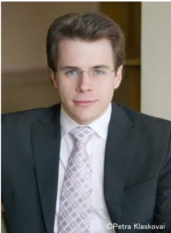
指揮：ヤクブ・フルシャ