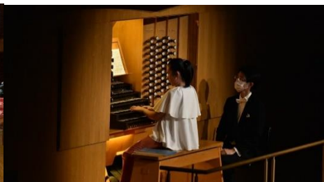
パイプオルガン・ミニコンサート