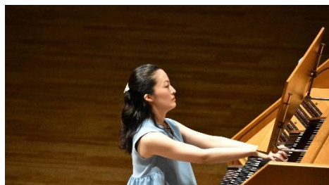
劇場オルガニストの演奏