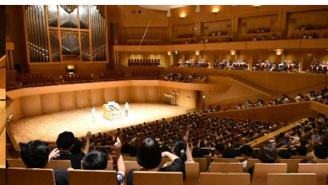
幼児向け・子ども向けあり