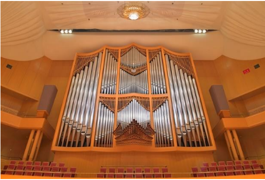
愛知県芸術劇場のパイプオルガン（国内最大級）