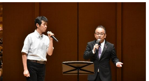
終演後にオルガン耳より講座