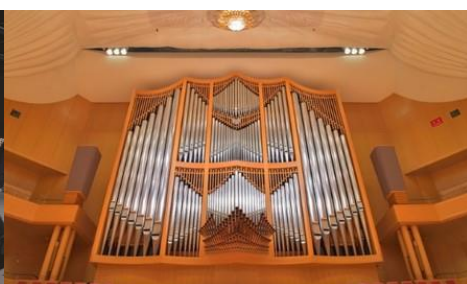
THE オルガン NIGHT&DAY2024