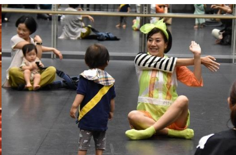
赤ちゃんとおどろう