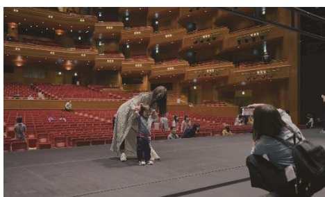
愛知県芸術劇場オープンハウス