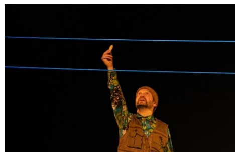
パック from スコットランド