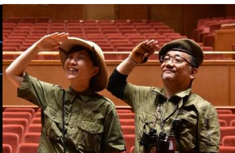
げきじょうたんけんツアー