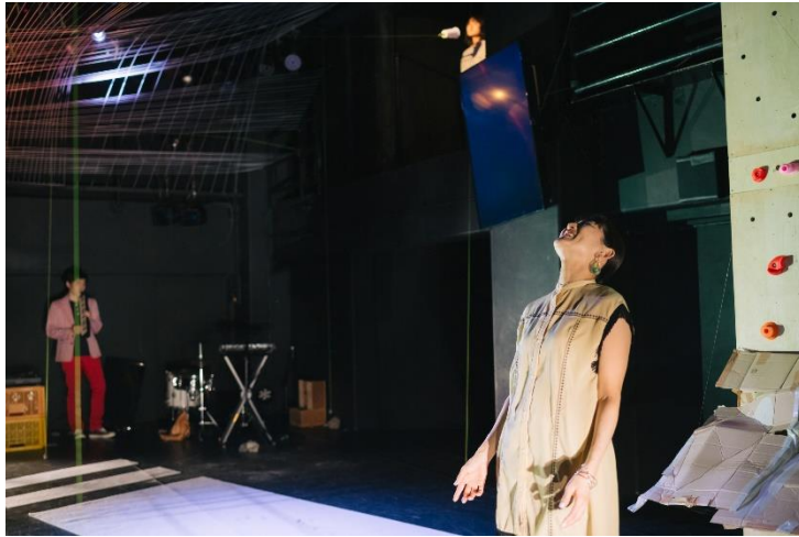
『ぼんやりブルース』初演(2021年10月こまばアゴラ劇場)