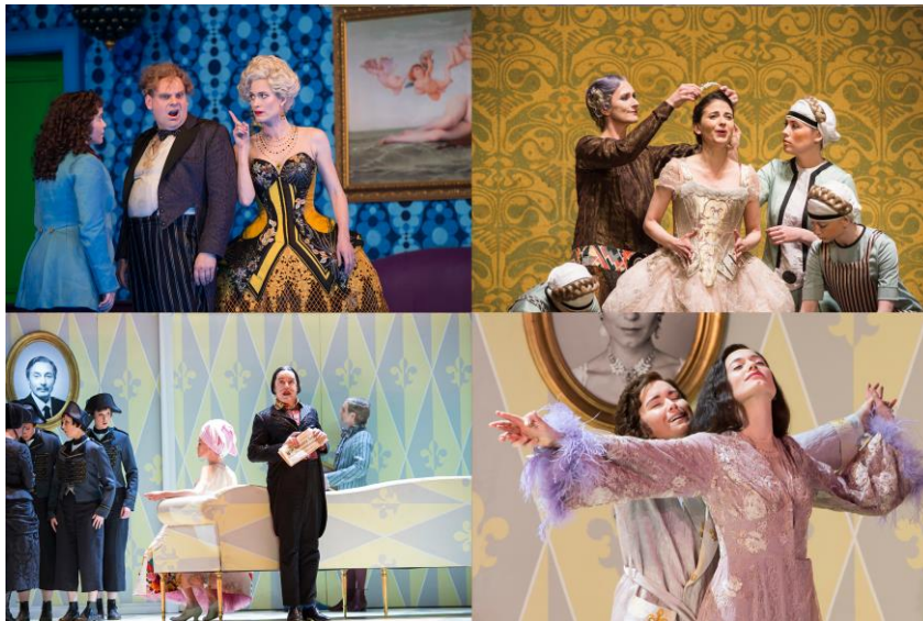
Glyndebourne Festival 2014

あらゆるオペラの中で最上級の美しさを誇る『ばらの騎士』。ザルツブルク音楽祭の創設者であるマックス・ラインハルト、ホフマンスタール、R.シュトラウスの3名によって、制作されました。初演の大ヒットから現在も世界中で上演の機会は多く、映画化もされたドイツ・ロマン派オペラの傑作です。そんな誰もが胸躍らせる恋物語が、愛知芸文フェスに登場します。本公演は、2015年に大英帝国勲章を受章したリチャード・ジョーンズが、14年の<イギリス・グラインドボーン音楽祭>にて演出し、ガーディアン紙などの様々なメディアにも報じられ、オペラ界に衝撃を与えました。ロマン溢れる華麗な世界を、オペラの壮大なスケールで、体感してみたいかでしょうか。初心者からオペラファンまで満足すること間違いなし。この貴重な機会をお見逃しなく。