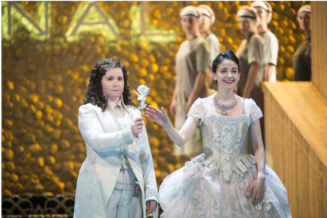
Glyndebourne Festival 2014

平素より愛知県芸術劇場の活動につきまして、ご理解・ご支援賜りありがとうございます。 さて、見出しのとおりプレスリリースを送付いたします。 ご多忙中恐縮ですが、ご一読の上、ご取材等いただければ幸いです。