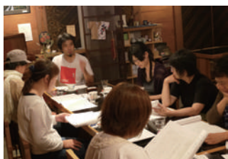
リーディング・カフェの様子(静岡開催時)