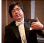
中川賢一 ピアニスト・指揮者

桐朋学園大学音楽学部でピアノを専攻、指揮も学ぶ。卒業後渡欧し、ベルギーのアントワープ音楽院ピアノ科最高課程、特別課程をそれぞれ優秀、首席の成績を収め修了。97年オランダのカウデアムス国際現代音楽コンクール第3位。世界各地で演奏活動を行い、アンサンブル・イクトッスのピアニストとしても活動。98年帰国後はソロ、室内楽、指揮で活躍。新作初演や他分野とのコラボレーションも多い。NHK-FM「名曲リサイタル」「現代の音楽」出演、サントリーサマーフェスティバル、東京の夏音楽祭、武生国際音楽祭等の音楽祭に参加多数。現代音楽初心者へのレクチャーコンサートやワークショップ、「Concert for KIDS-0才からのクラシック」など子供向けプロジェクトも多数。愛知県芸術劇場でも、あいち子ども芸術大学2008「ダンス×音楽:コラボ体験!!」講師、連続講座「ケージを知る」プリバード・ピアノワークショップとコンサート(2012)出演等。「アンサンブルノマド」ピアニスト・指揮者。地域創造おんかつ登録アーティスト。お茶の水女子大学、桐朋学園大学非常勤講師。