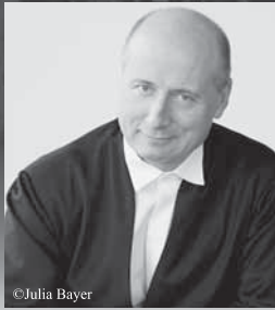
指揮 パーヴォ・ヤルヴィ Paavo Järvi, Conductor