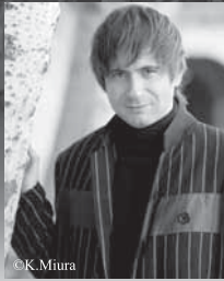
ピアノ ピョートル・アンデルジェフスキ Piotr Anderszewski, Piano