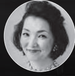
たかはし のぶこ ソプラノ / 高橋 薫子